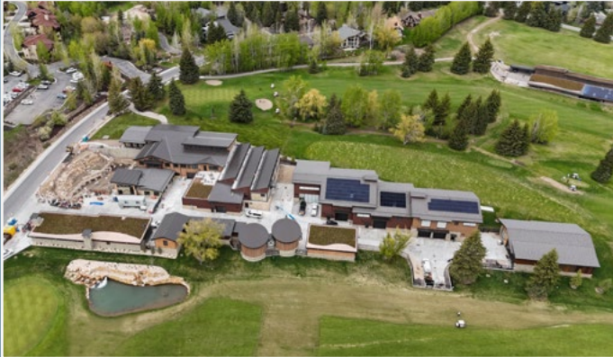
PLANTA DE TRATAMIENTO DE AGUA 3KINGS COMENZÓ A PRODUCIR POTABLE AGUA DE LOS TÚNELES DE LAS MINAS JUDGE Y SPIRO EN LA PRIMAVERA DE 2024.

beber agua todos los días. La planta utiliza un tratamiento de aguas superficiales convencional tecnología que incluye preoxidación, floculación, sedimentación, filtración y adsorción para eliminar metales pesados, incluidos arsénico, antimonio, hierro, manganeso, zinc, cadmio, talio y plomo a niveles no detectables o ultrabajos. La planta También utiliza luz ultravioleta e hipoclorito de sodio (lejía) generado in situ para eliminar virus y patógenos mediante la desinfección. Hacer referencia al diagrama de abajo para obtener una representación visual de los procesos de la planta de tratamiento mencionados anteriormente.