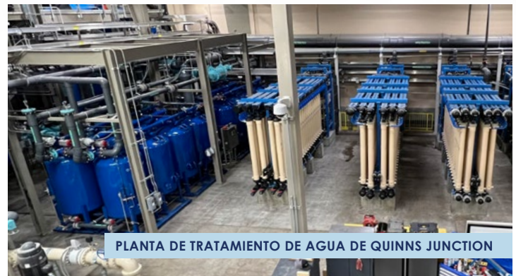
PLANTA DE TRATAMIENTO DE AGUA DE QUINNS JUNCTION

El agua comprada al Distrito de Servicios Especiales de Jordanelle (JSSD) es suministrado predominantemente a los vecindarios de Deer Valley. Agua comprada de JSSD proviene de aguas subterráneas clasificadas como "bajo la influencia de agua superficial" y se transporta a través del Túnel de Drenaje No. 2 de Ontario. Esta agua es tratada en la Planta de Tratamiento de Agua de Keetley, que utiliza cal. ablandamiento y filtración para reducción de metales e inactivación de patógenos.